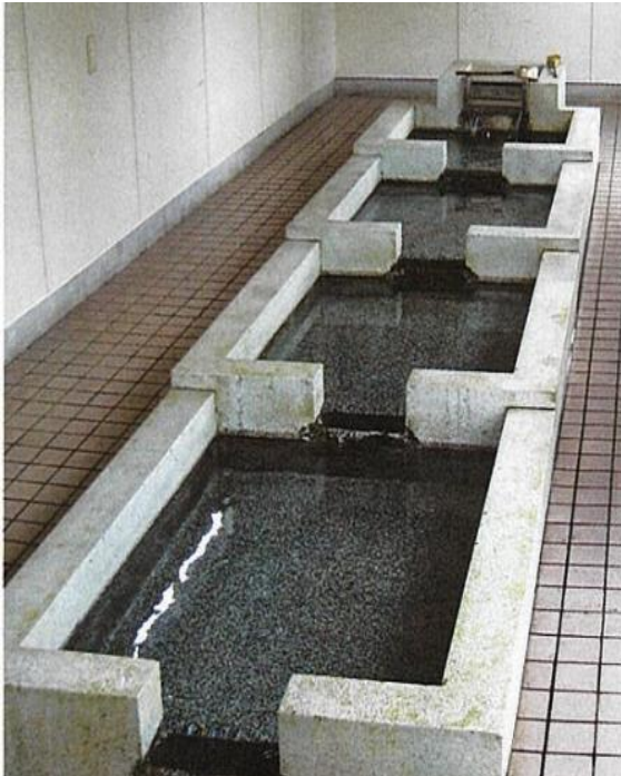
〈出典〉富山県教育委員会「ふるさととやまの自然・科学ものがたり」富山県教育委員会、2021年